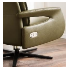
Armlehne 1 (= 9 cm breit)