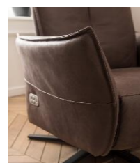
Armlehne 2 (= 15 cm breit)