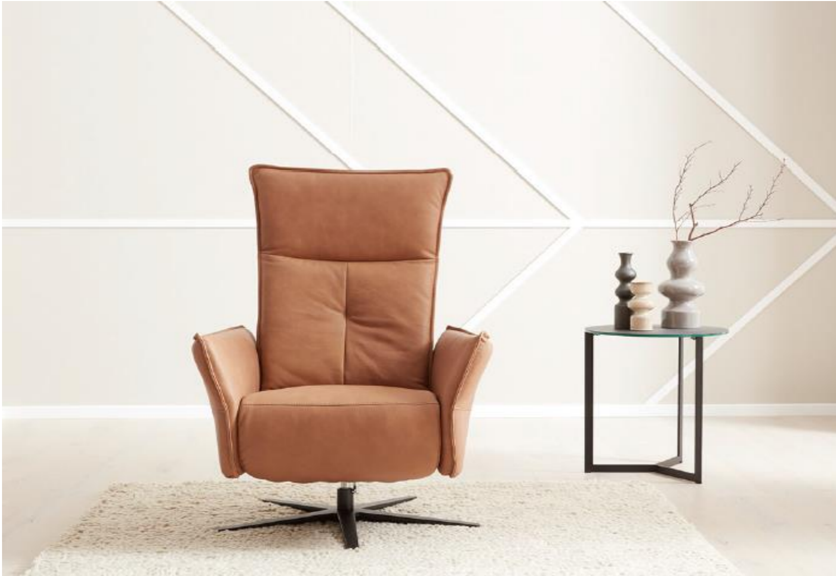
Funktionssessel mit Rückenoptik 2 im Bezug Leder Ceva macchiato